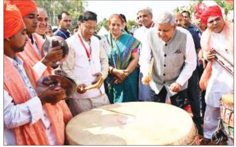
उपराष्ट्रपति जगदीप धनखड़ कृषि विकास मेले में ढोल बजाते हुए।

उन्होंने इस बात पर प्रकाश डाला कि हमारी कृषि-खाद्य प्रणालियां एक दुष्चक्र में फंस गई हैं और हमें इस "चक्रव्यूह" को तोड़ने की जरूरत है। राष्ट्रपति ने जैव विविधता बढ़ाने और पारिस्थितिकी तंत्र को बहाल करने की आवश्यकता पर भी जोर दिया ताकि सभी के लिए अधिक समृद्ध और न्यायसंगत भविष्य के साथ-साथ कृषि-खाद्य प्रणालियों के माध्यम से खाद्य और पोषण सुरक्षा सुनिश्चित की जा सके।